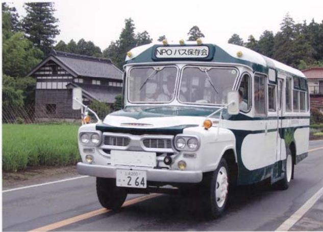
ボンネットバス(試乗予定車)

日程 9月6日(火) & 試乗会 会場 産業技術総合研究所 つくばセンター共用講堂 茨城県つくば市東1-1-1 中央第1 参加費 無料