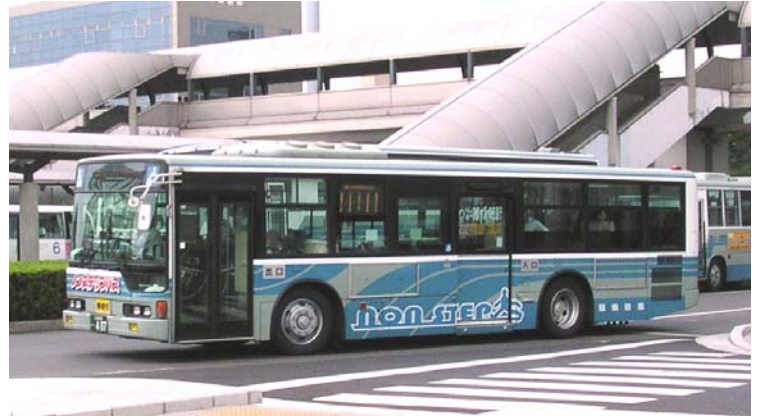
最新式標準仕様ノンステップバス(例)

主催 社団法人計測自動制御学会システムインテグレーション部門福祉工学部会(幹事部会)・同ユニバーサルデザイン部会・同自動化システム部会 共催 独立行政法人産業技術総合研究所 協賛 特定非営利活動法人日本バス文化保存振興委員会(NPOバス保存会)、日本バス友の会、関鉄観光バス株式会社、関鉄自動車工業株式会社 後援 国土交通省、産業技術連携推進会議福祉技術部会、つくば市、つくば市教育委員会、つくば市社会福祉協議会、社団法人茨城県バス協会