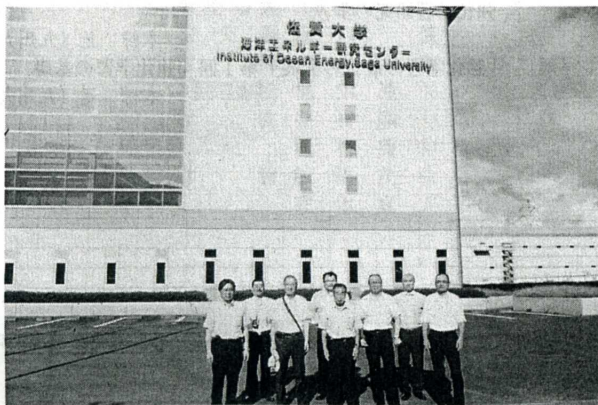
写真1 海洋エネルギー研究センター前での集合写真

温度差発電は、アンモニアと水の混合物を表層の高温度で蒸発させてタービンを回し、深層の低温度で凝縮するカーリーナサイクルを構成して発電を行うもので、20°C以上の温度差があれば発電を継続でき、研究センターでは、1994年からアンモニアと水の混合物を媒体とする実用化研究を行っている。